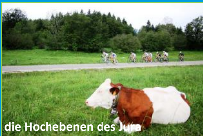
die Hochebenen des Jura