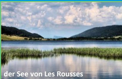
der See von Les Rousses