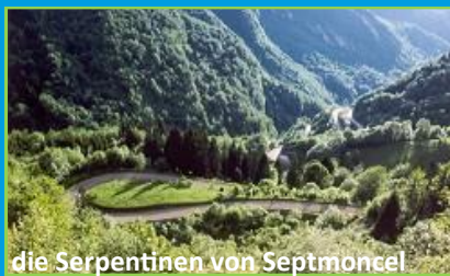
die Serpentina von Septmoncel